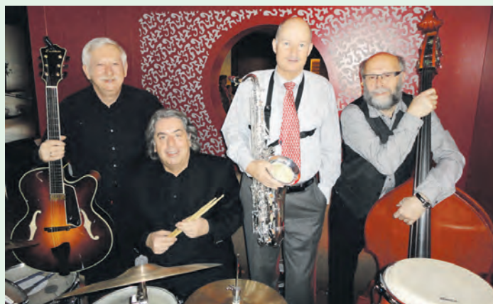
Die Iron Street Jazz Band – live in Leoben und Vordernberg